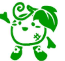
農園マスコット「あまうりん」